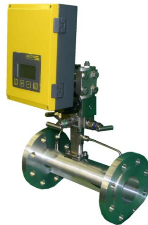
EDZ 150.1 für Gase

Das nachfolgend vorgestellte Messsystem erfüllt diese Anforderungen fast lückenlos. Es ist für die Stoffströme Wasser, sonstige Flüssigkeiten, Dämpfe und Gase gleich gut geeignet.