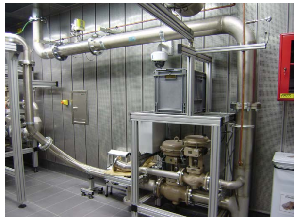
Druckluftmessung in einem Turboladerprüfstand eines italienischen Sportwagenherstellers