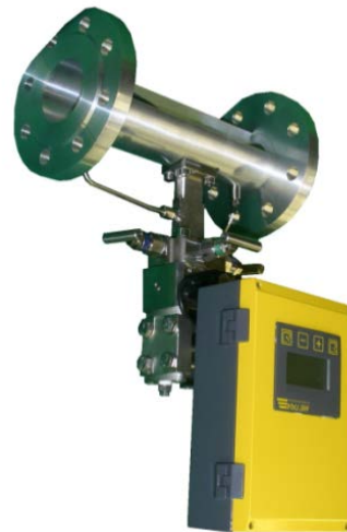
EDZ 150.1 für Flüssigkeiten, Wasser und Dämpfe

Der Durchfluss- und Energiezähler EDZ/EWZ 150.1 besteht aus einem klassischen Venturirohr als Volumengeber, einem hochauflösenden Differenzdrucktransmitter, einer integrierten Druck- und Temperaturerfassung und einem Durchfluss- und Energierechner. Entsprechend dem zu messenden Stoffstrom wird das Gerät hängend (Wasser, sonstige Flüssigkeiten, Dämpfe) oder stehend (Gase) eingebaut. Bei höheren Temperaturen (> 250°C) wird die Umformertechnik hydraulisch vom Venturirohr getrennt.